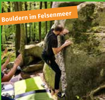
Bouldern im Felsenmeer

Die ersten Gruppen waren schon auf Tour und haben uns tolle Eindrücke mitgebracht: