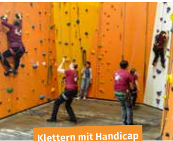
Klettern mit Handicap