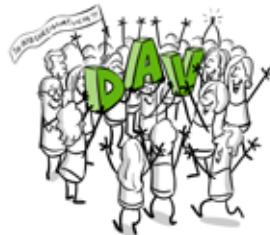
EHRENAMTLICHES ENGAGEMENT FINDEN WIR SUPER!

Also: Macht mit! Alle Infos zum Ehrenamt in unserer Sektion findet Ihr unter: www.dav-fulda.de/Unser-Verein/Ehrenamt ■