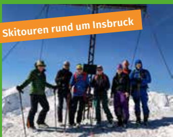
Skitouren rund um Innsbruck