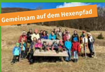
Gemeinsam auf dem Hexenpfad